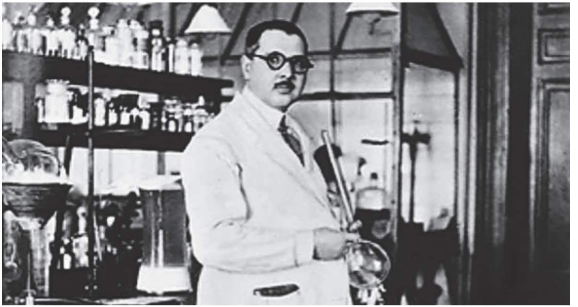
Zemplén Géza (1883–1956)

Zemplén Géza számára a zene az igényes szellemi szórakozás mellett emlékeztetőfejlesztő funkciót töltött be. Szakmájához ugyancsak szükség volt a pontos emlékezésre, mert a vegyi tudomány nem tűri a pontatlanságot. A budapesti Pázmány Péter Tudományegyetem természetrajz – kémia szakán végzett 1904-ben. Még ugyanebben az