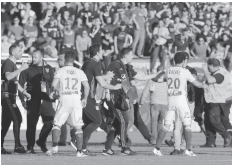
Féلبeszakadt a Bastia – Lyon mérkőzés a francia bajnokság 33. fordulójában, miután a házigazdák szurkolói bántalmazni akarták a vendégcsapat játékosait

* Olasz Serie A, 32. forduló: Inter – AC Milan 2-2, AS Roma – Atalanta 1-1, Palermo – Bologna 0-0, Cagliari – Chievo 4-0, Torino – Crotone 1-1, Fiorentina – Empoli 1-2, Pescara – Juventus 0-2, Genoa – Lazio 2-2, Sassuolo – Sampdoria 2-1, Napoli – Udinese 3-0; 33. forduló: Atalanta – Bologna 3-2,